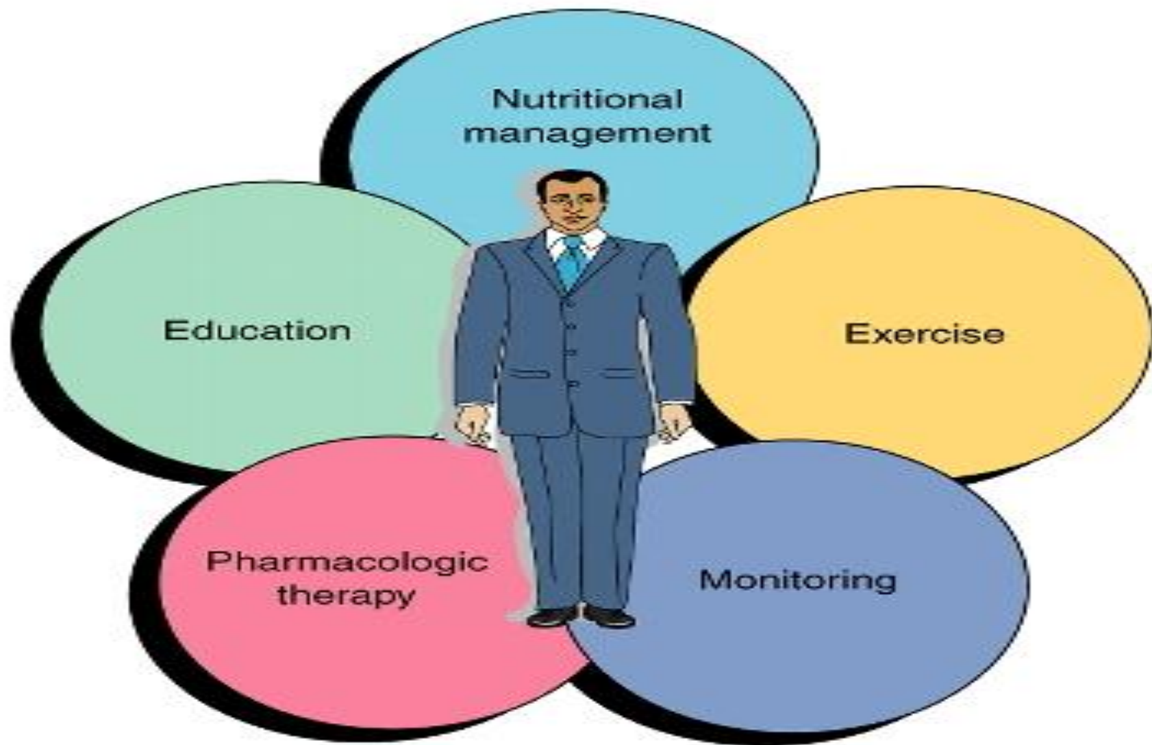
Figure 41-2 The five components of diabetes management.